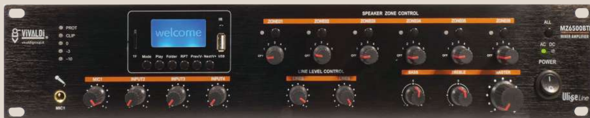
Mixer amplificati multizona, multisorgente con player (WiFi, USB, MP3, Webradio, Bluetooth, SD card) integrato. Multizone multi-source amplifier mixer with integrated player (WiFi, USB, MP3, Webradio, Bluetooth, SD card).