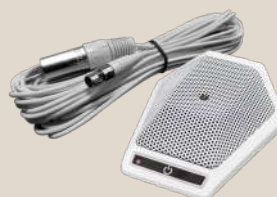
Microfono da superficie di colore bianco o nero. Surface microphone white or black color.