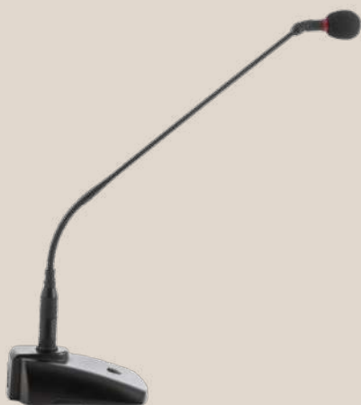
Base microfonica con microfono flessibile. Microphone base with flexible microphone.

Recorder, message customizable generator (sounds, bells, alarms), scheduler programmable via LAN, built-in microphone.