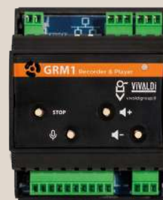
Registratore, generatore di messaggi personalizzabili (suoni, campane, allarmi), scheduler programmabile via LAN, microfono integrato.

Recorder, message customizable generator (sounds, bells, alarms), scheduler programmable via LAN, built-in microphone.