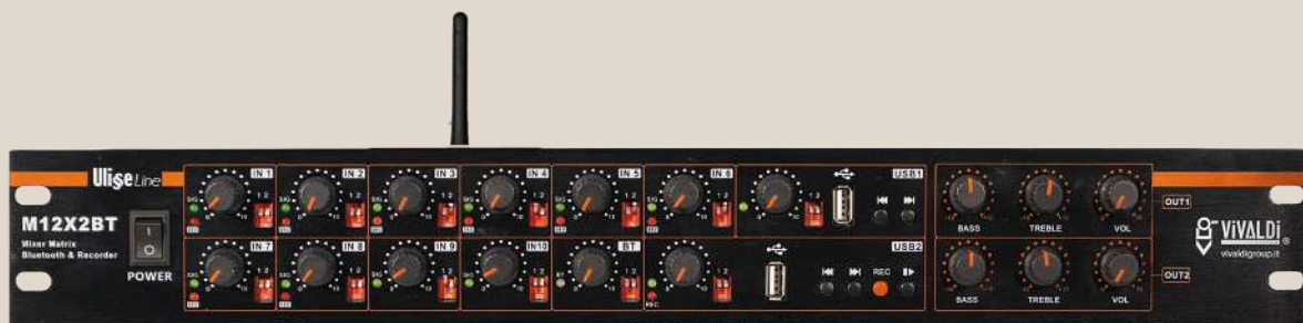
Mixer 13 canali a 2 uscite, con Bluetooth e registratore su USB. Mixer 13 channels 2 outputs, with Bluetooth and USB recorder.