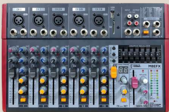
Mixer multieffetto 5, 8, 12 canali. Multi-effect mixer 5, 8, 12 channels.